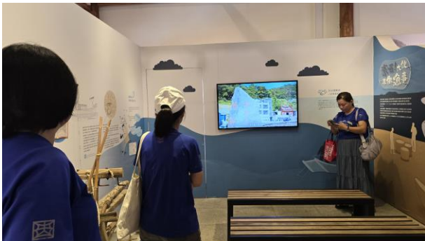
橋仔漁業展示館參訪