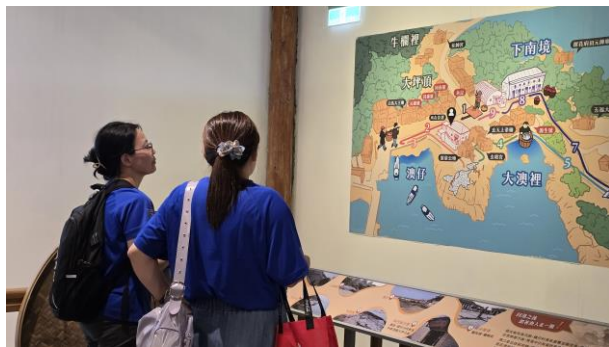
橋仔漁業展示館參訪