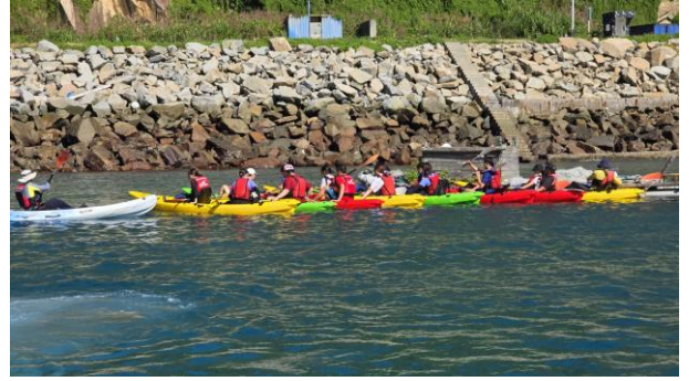
獨木舟海上操舟體驗