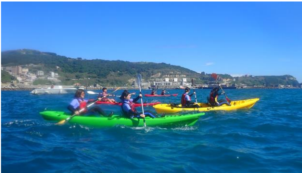
獨木舟海上操舟體驗