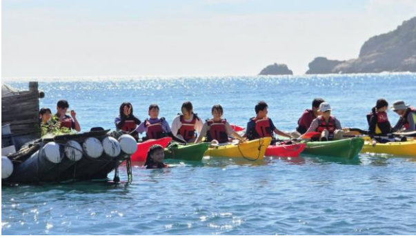
獨木舟海上操舟體驗