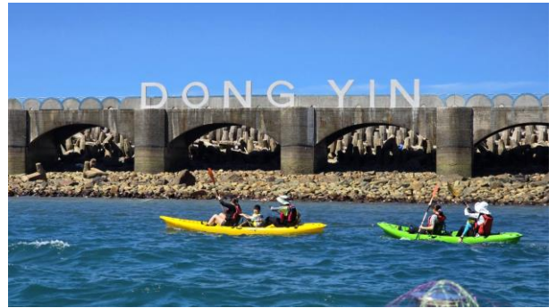
獨木舟海上操舟體驗