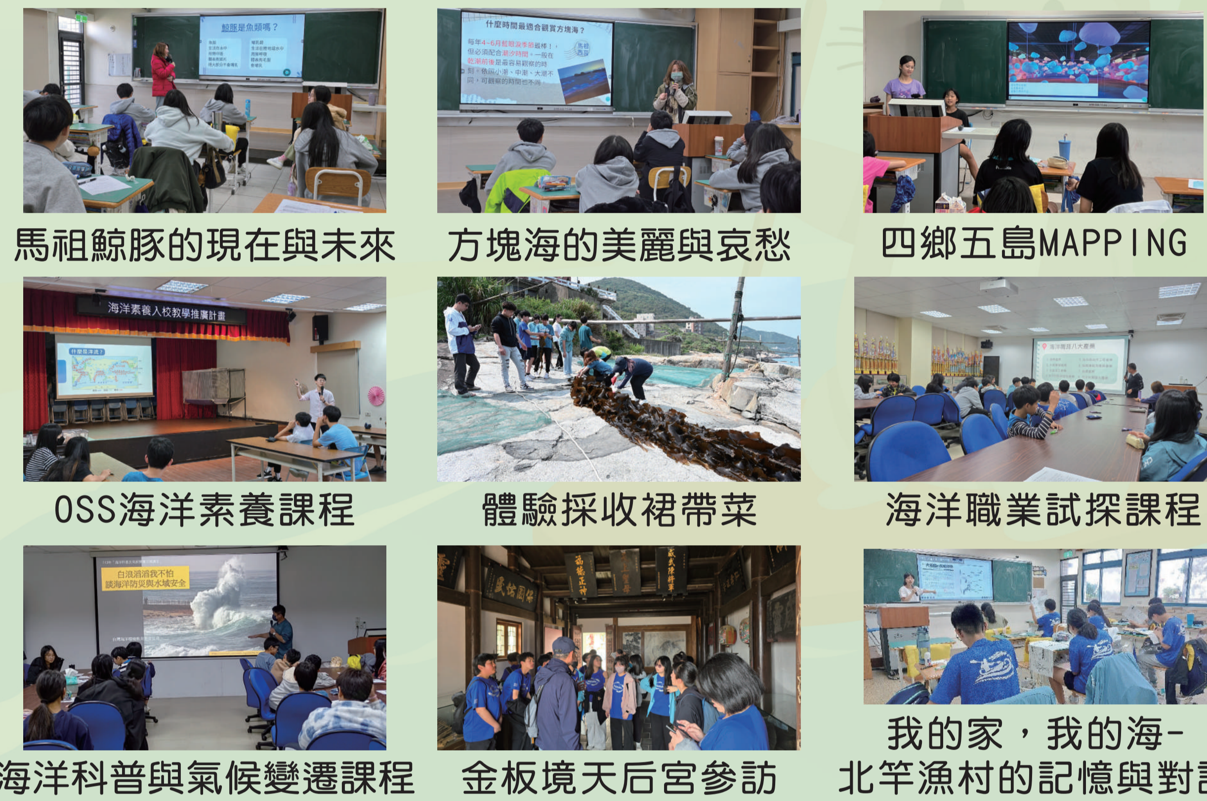
馬祖鯨豚的現在與未來