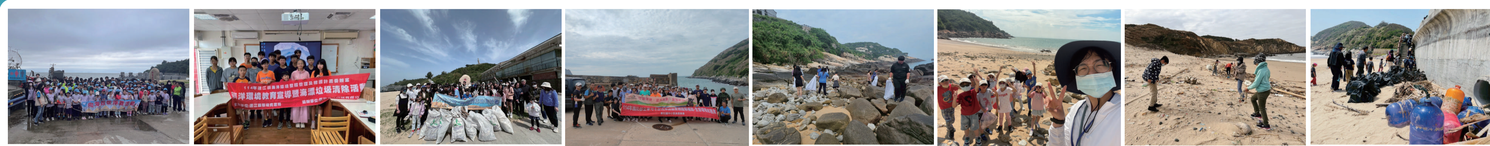
中正國中小 敬恆國中小 介壽國中小 東引國中小 中山國中 仁愛國小 東莒國小 塘岐國小