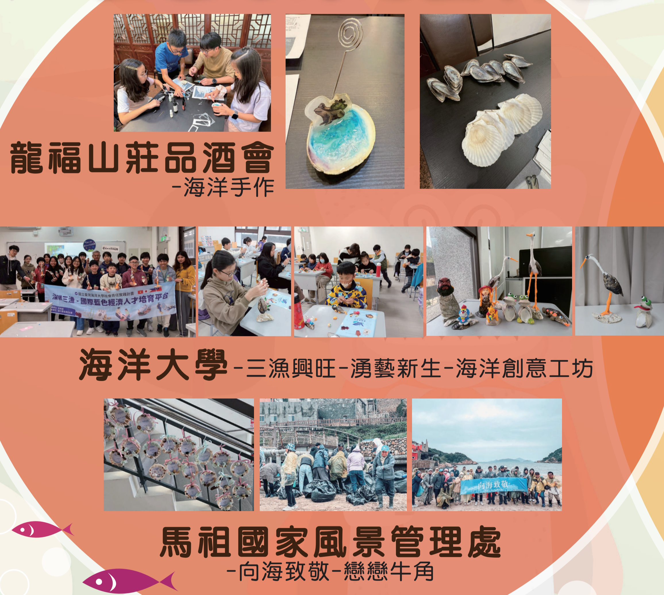
龍福山莊品酒會-海洋手作