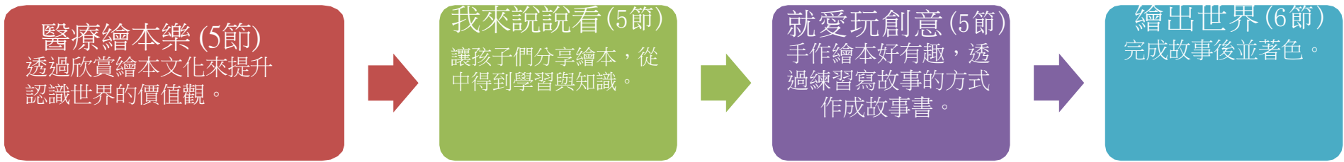
課程架構脈絡圖(單元請依據學生應習得的素養或學習目標進行區分)(單元脈絡自行增刪)