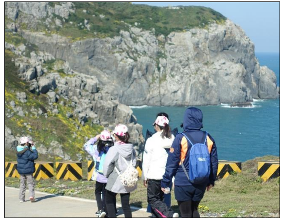
一邊欣賞海景一邊留下紀錄