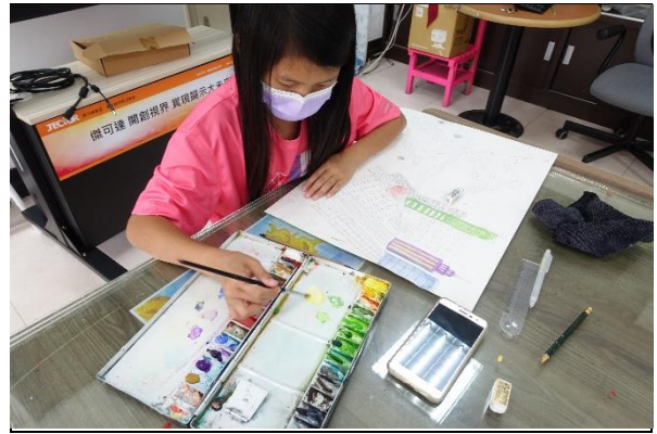
用疊色、接色畫出心中的海市蜃樓