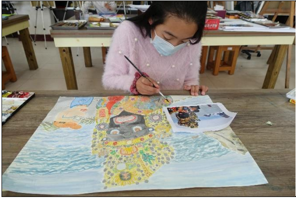
仔細描繪，並控制水分